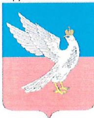
Магнит с изображением герба