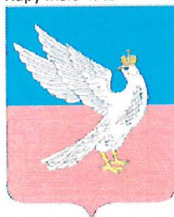
Магнит с изображением герба