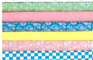
Отрезки ситцевых тканей